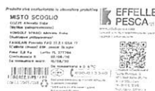
Inserire immagine due: